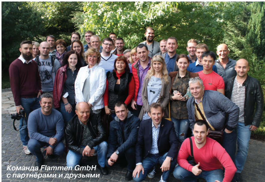
Команда Flammen GmbH с партнёрами и друзьями